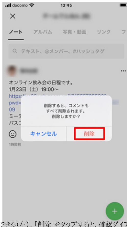
「投稿を修正」をタップすると、投稿した内容を編集できる(左)。「削除」をタップすると、確認ダイアログが表示される(右)