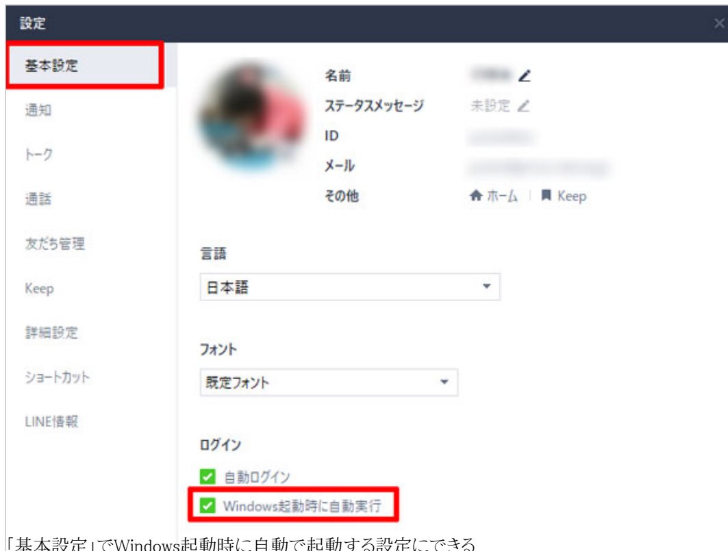
「基本設定」でWindows起動時に自動で起動する設定にできる