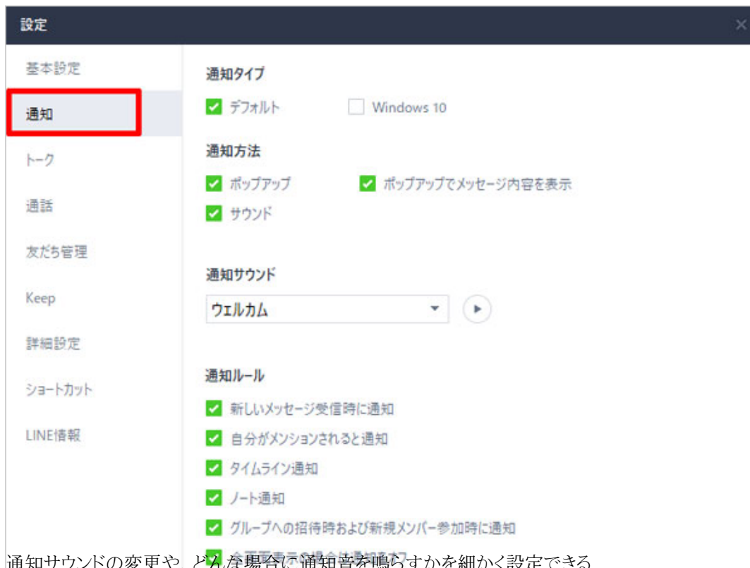
通知サウンドの変更や、どんな場合に通知音を鳴らすかを細かく設定できる