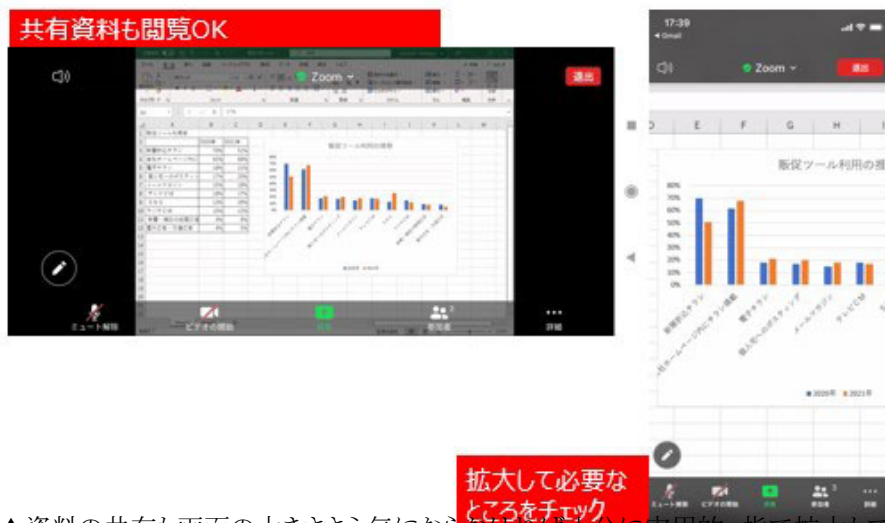
▲資料の共有も画面の大きさを気にしなければ十分に実用的。指で拡大できるので、視認性は確保できる

相談者さんが気にしていた、共有資料の表示はどうでしょう。ホスト側から共有された資料を表示してみましたが、横向きの画面表示にすればパソコンと同様に閲覧できました。縦位置の画面表示で横長の資料を共有すると、文字が小さくなってしまいます。でもそこはスマホですから、二本指で広げるように操作すれば簡単に拡大できます。お使いのスマホの画面のサイズにもよりますが、よほど小さな文字などの資料の共有でなければ、スマホでも十分に内容を確認できそうです。自分から画面や資料を共有することも可能です。DropboxやGoogleドライブ、OneDriveといったストレージの共有にも対応しています。