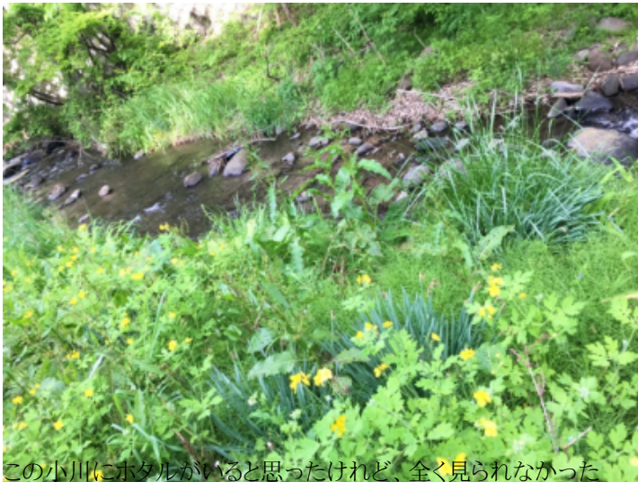
この小川にホタルがいると思ったけれど、全く見られなかった

その何日か後、地区の行事で一緒になった近所のおじさんに聞いてみると、「昔はどこでも一面に飛んでいたけれど、今はもう全然見ないなあ」という返事。自然が豊かそうに見えるこの場所でも、ホタルは見られなくなっているらしい。「今どき、保護地以外でホタルを見るのは難しいんだなあ」と実感した。北杜市内には、ホタルが観察できる公園がいくつかあるから、そこへ行こうかなと思いながら数日が過ぎた。