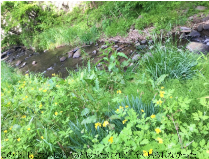
この小川にホタルがいると思ったけれど、全く見られなかった

その何日か後、地区の行事で一緒になった近所のおじさんに聞いてみると、「昔はどこでも一面に飛んでいたけれど、今はもう全然見ないなあ」という返事。自然が豊かそうに見えるこの場所でも、ホタルは見られなくなっているらしい。「今どき、保護地以外でホタルを見るのは難しいんだなあ」と実感した。北杜市内には、ホタルが観察できる公園がいくつかあるから、そこへ行こうかなと思いながら数日が過ぎた。