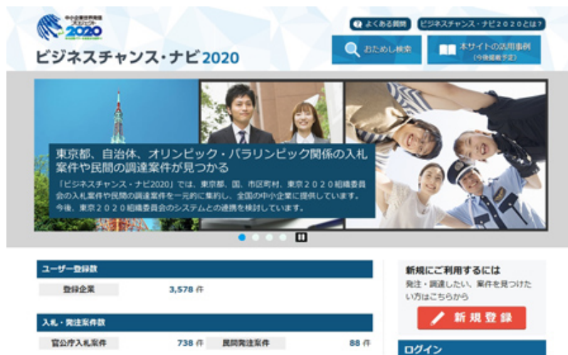
東京都中小企業振興公社が運営する「ビジネスチャンス・ナビ2020」

東京都は2016年2月から「中小企業世界発信プロジェクト2020」を本格始動。その一環として、4月に東京五輪に関連する官民の入札・調達情報を一元的に集約したポータルサイト「ビジネスチャンス・ナビ2020」をオープンした。中小企業に発注情報などを提供し、受注機会の拡大を支援するのが目的だ。